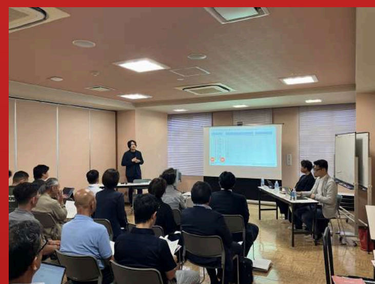
令和6年7月9日 キックオフイベント

https://www.s-itoc.jp/support/business-support/dxmodel/dxmodel-seminar/1413