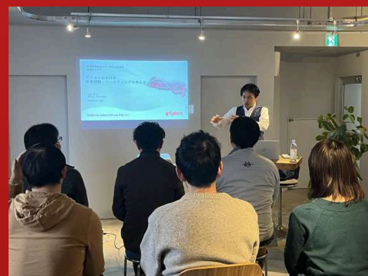
令和7年1月21日 特別セミナー 「ビジョンにおける事業開発・マーケティングの考え方」